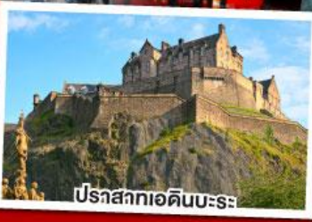
ปราสาทเอดิเนบะระ