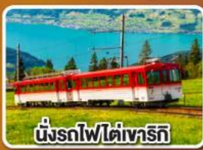
นั่งรถไฟใต้เขาโรท