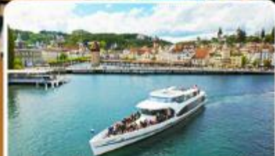
ล่องเรือทะเลสาบลูซิิร์น