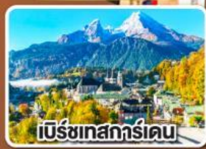
เบิร์ชเทสการ์ดเดน

เข้าชมเมืองกล็อบราเดน แห่งเมืองเบิร์ชเทสการ์ดเดน