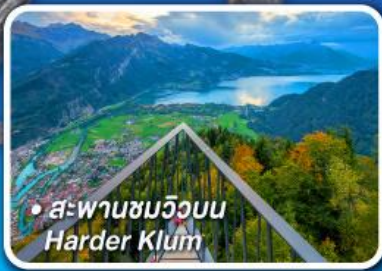
• สะพานชมวิวนบน Harder Klum