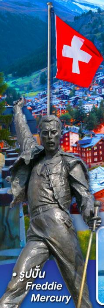
• รูปปั้น Freddie Mercury

พีชิต 5 เวกริก, เวกฮาร์เคอร์คุม, เวกจุงเฟรรา เวกลาเซียร์ 3000 และ เวกกรอนเนือร์แกรต