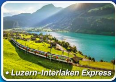
• Luzern-Interlaken Express