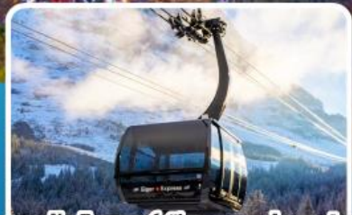
กระเช้า ไอเกอร์เอ็กซ์เพรส สู่ยอดเขาจุงเฟรา