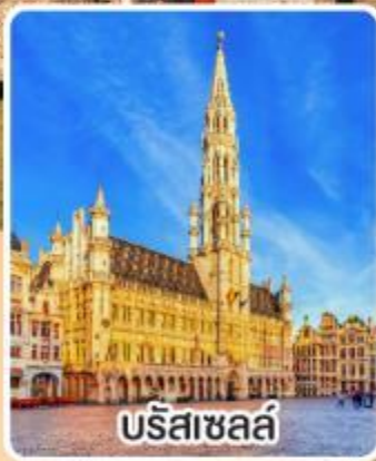
บรัสเซลส์