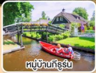
หมู่บ้านกีร์รุ่น