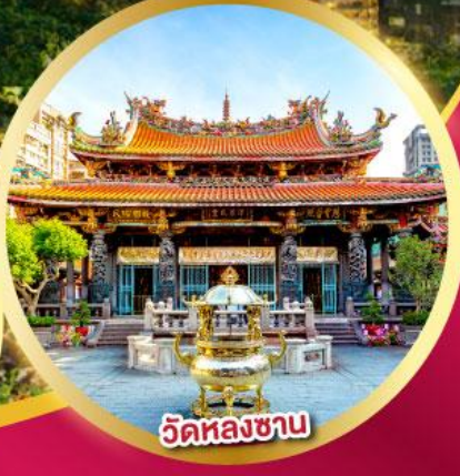
วัดหลงชาน