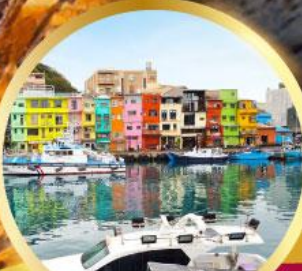
หมู่บ้านชาวประมง