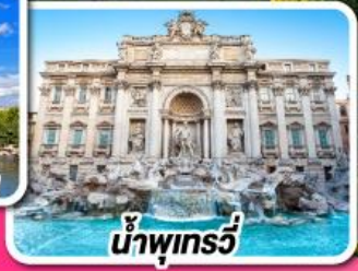
น้ำพุเทรวี่