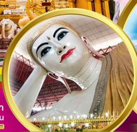
พระนอนตาวาน