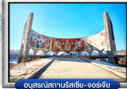
อนุสรณ์สถานรัสเซีย-จอร์เจีย