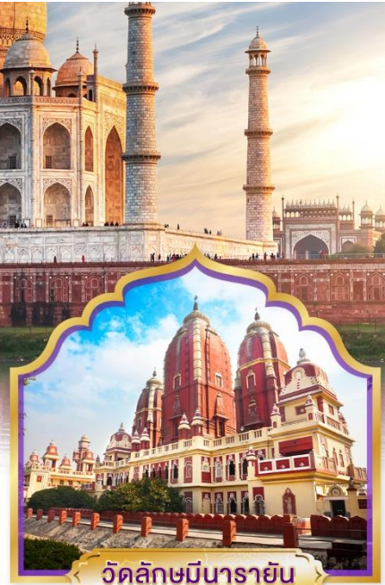
วัดลักษมีนารายณ์