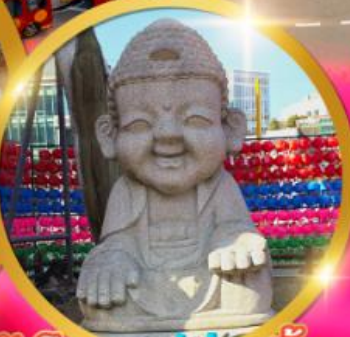
ดาเฟสไตลเกาหลี่ Hyegyeonggung