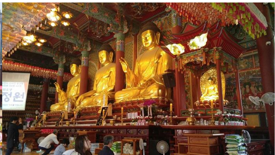
สภาพการณ์ปัจจุบัน