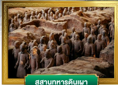
สุสานทหารดินเผา