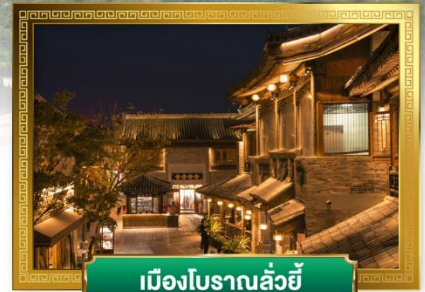
เมืองโบราณลั่วอี้