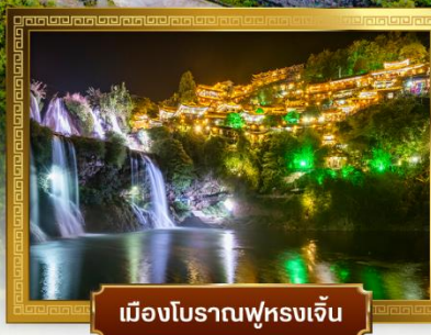
เมืองโบราณฟุหรงเจิน