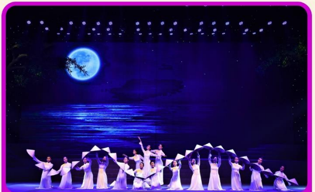
ชมการแสดง Charming Show Danang