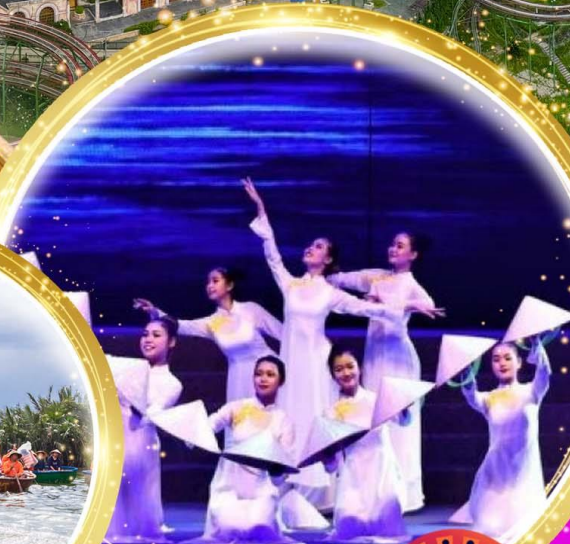
โชว์สุดอลังการ Charming at danang