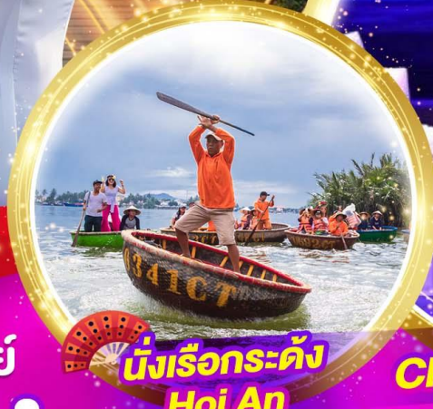
นั่งเรือกระด้ง Hoi An