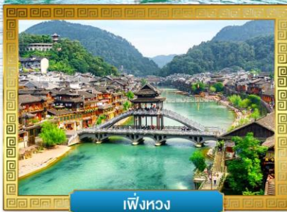
เฟิ่งหวง