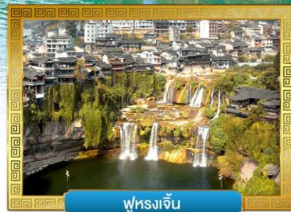
ฟูหยงเจิน