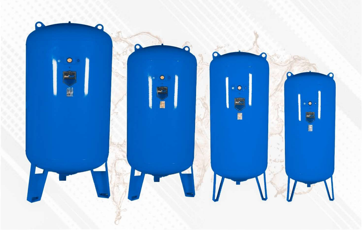
ÜRÜN RENK KARTELASI PRODUCT COLOR CHART