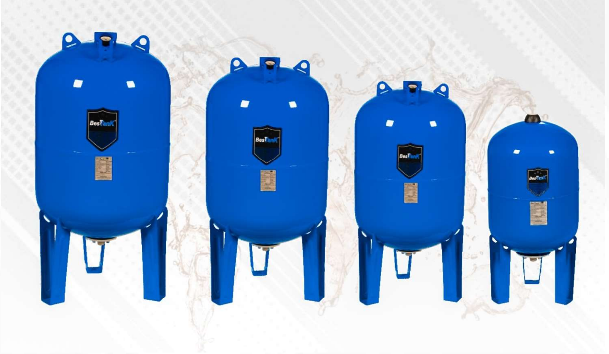
ÜRÜN RENK KARTELESİ PRODUCT COLOR CHART