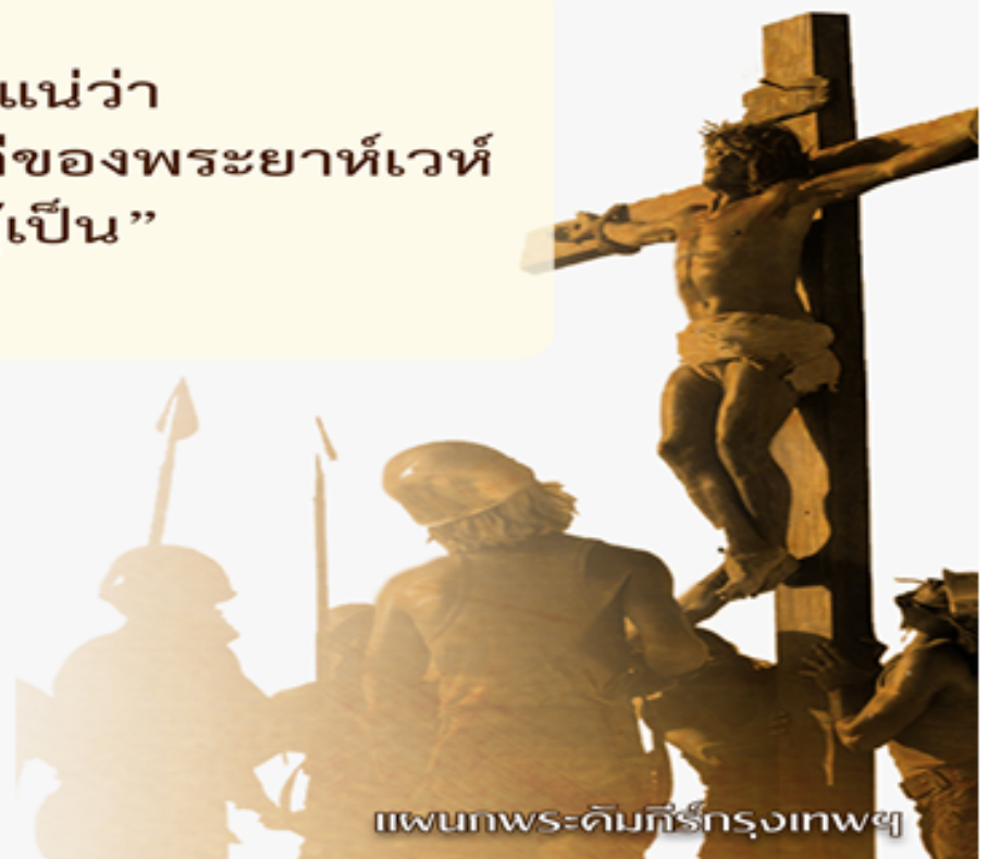
แผนพระคัมภีร์กรุงเทพฯ

“ข้าพเจ้าเชื่อแน่ว่า จะได้เห็นความดีของพระยาห์เวห์ ในแผ่นดินแห่งผู้เป็น” (สดด. 27:13)