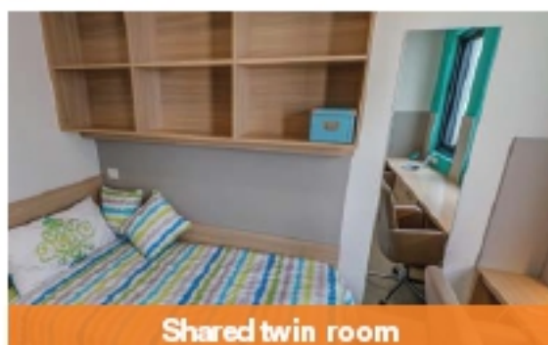
Shared twin room