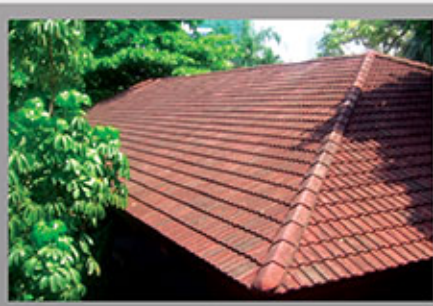
ก่อนเข้ารับบริการ