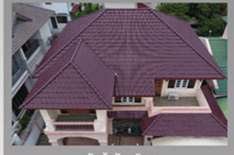
หลังเข้ารับบริการ