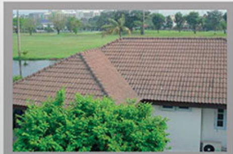
ก่อนเข้ารับบริการ