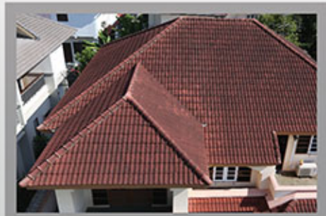
ก่อนเข้ารับบริการ