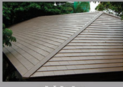
หลังเข้ารับบริการ