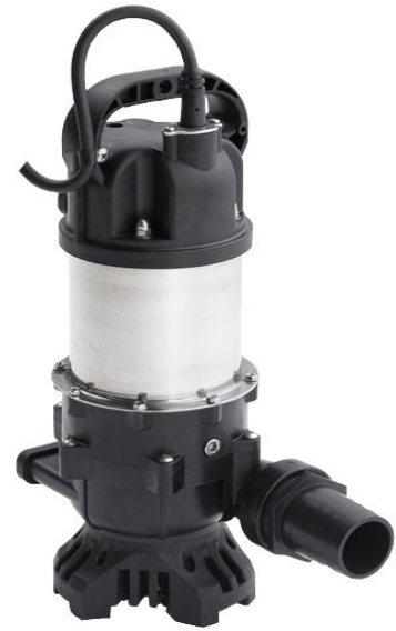
ตั้งได้นอนได้