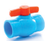
บอลวาล์ว 18-55 มม. (1/2"-2")