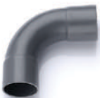
ข้อโค้ง 90° H บาน2 เกษตร 10-55 มม. (1/4" - 2")