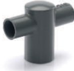
สี่ทางผ่าครอบลด - เกษตร เทา 25x18-100x55 มม. (1"x1/2"-4"x2")