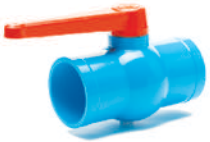
บอลวาล์ว 65-100 มม. (2 1/2"-4")