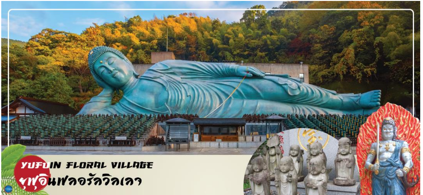
YUFUIN FLORAL VILLAGE ฟูอินฟลอรัลวิลเลจ

จากนั้นเดินทางสู่ เมืองฟูกุโอกะ (Fukuoka) (ใช้เวลาเดินทางประมาณ 2 ชั่วโมง) เป็นเมืองที่ใหญ่ที่สุดของเกาะคิวชู ประเทศญี่ปุ่น เป็นเมืองท่าที่สำคัญมานานหลายร้อยปี มีแหล่งท่องเที่ยวทั้งทางธรรมชาติ วัฒนธรรม ตลอดจนแหล่งช้อปปิ้ง และอาหารหลากหลาย เรียกว่าเป็นเมืองที่ครบครัน ทำให้เป็นที่นิยมของนักท่องเที่ยวจำนวนมาก