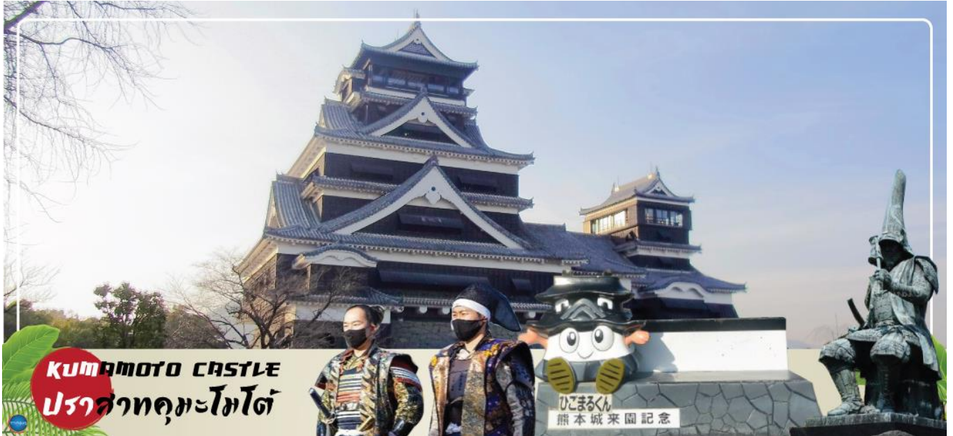
KUMAMOTO CASTLE ปราสาทคุมะโมโตะ

ได้เวลาอันสมควรนำท่านเดินทางสู่ เมืองเบปปุ (Beppu) (ใช้เวลาเดินทางประมาณ 2 ชั่วโมง) เมืองในจังหวัดโออิตะ ตั้งอยู่บนชายฝั่งทะเลตะวันออกของเกาะคิวชู ประเทศญี่ปุ่น เป็นเมืองท่องเที่ยวชั้นนำพร้อมยอดนิยมนิยมของญี่ปุ่น จัดเป็นเมืองที่มีรีสอร์ตหน้าแร่มากที่สุด นักท่องเที่ยวนิยมมาแช่ออนเซนหรืออบทรายร้อนริมทะเลที่เมืองนี้