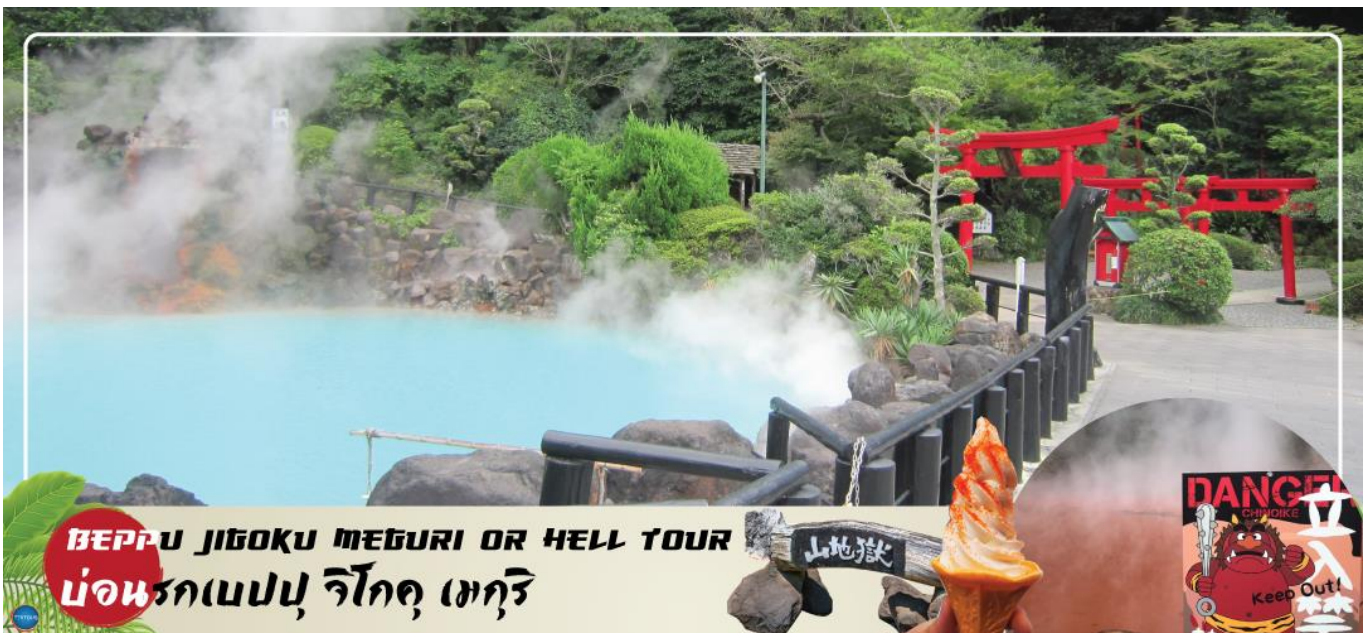
BEPPU JIGOKU MEGURI OR HELL TOUR บ่อนรกเบปปุ จิโกคุ เมกุริ

เมืองเบปปุ – บ่อนรกเบปปุ จิโกคุ เมกุริ (เข้าชม 2 บ่อ) – เมืองยุฟูอิน – หมู่บ้านยุฟูอินฟลอร์รัล – ทะเลสาบคิริน – เมืองฟุกุโอกะ – วัดนันโซอิน – ดิวตี้ฟรี – กันดั้ม ปาร์ค ฟุกุโอกะ