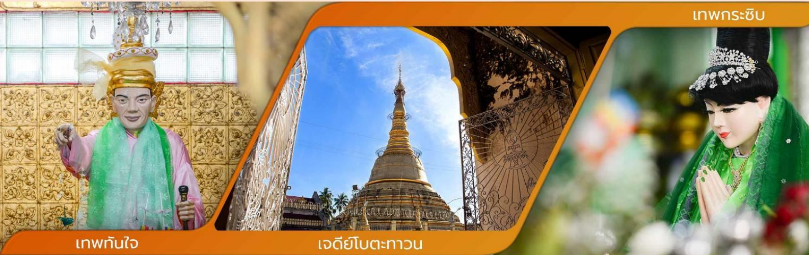
เทพทันใจ

คำบูชาเทพทันใจ เอหิ สักกะ มหานัทโปะโปะจีโปตะถ่องสิทธิมัตถุ อิทังพะลัง เอตัสสะมิงรัตตะนัง พุทธัง ธัมมัง สังฆัง เทวานัง ประสิทธิลาโภ ชโยนิจจัง วันทามิสัพพะทา สวาโหม