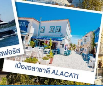
เมืองอลาซาตี ALACATI