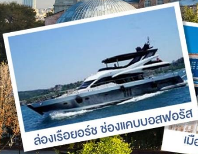
ล่องเรือยอร์ช ช่องแคบบอสฟอรัส