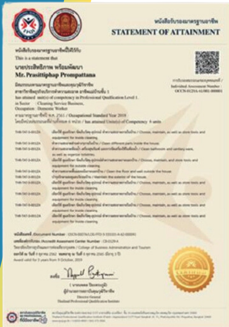
1. ใบประกาศนียบัตร คุณวุฒิวิชาชีพ