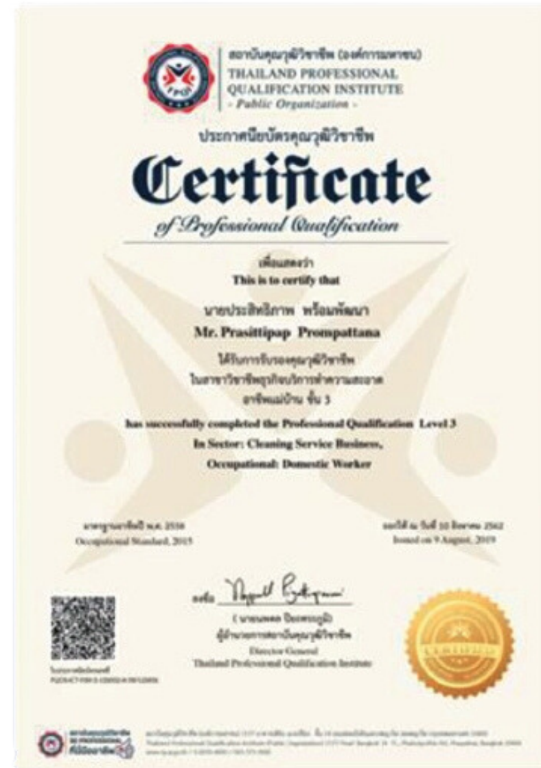
2. หนังสือรับรอง มาตรฐานอาชีพ