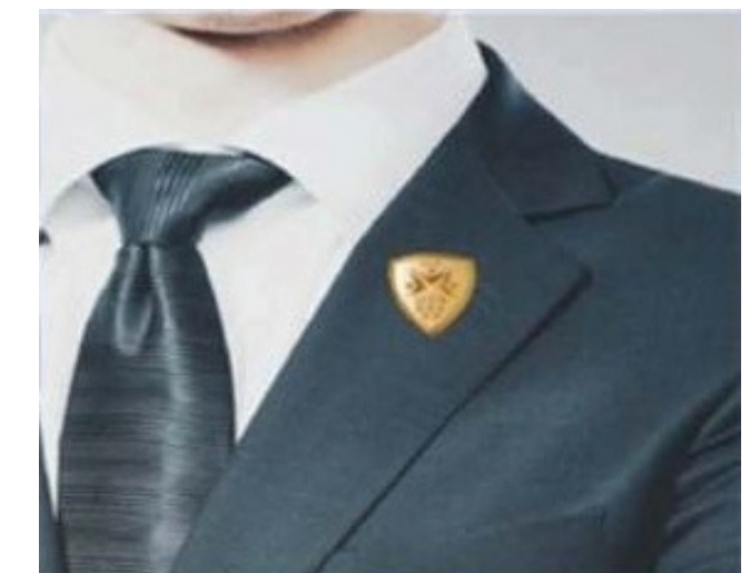
4. เข็มกลัด มอช