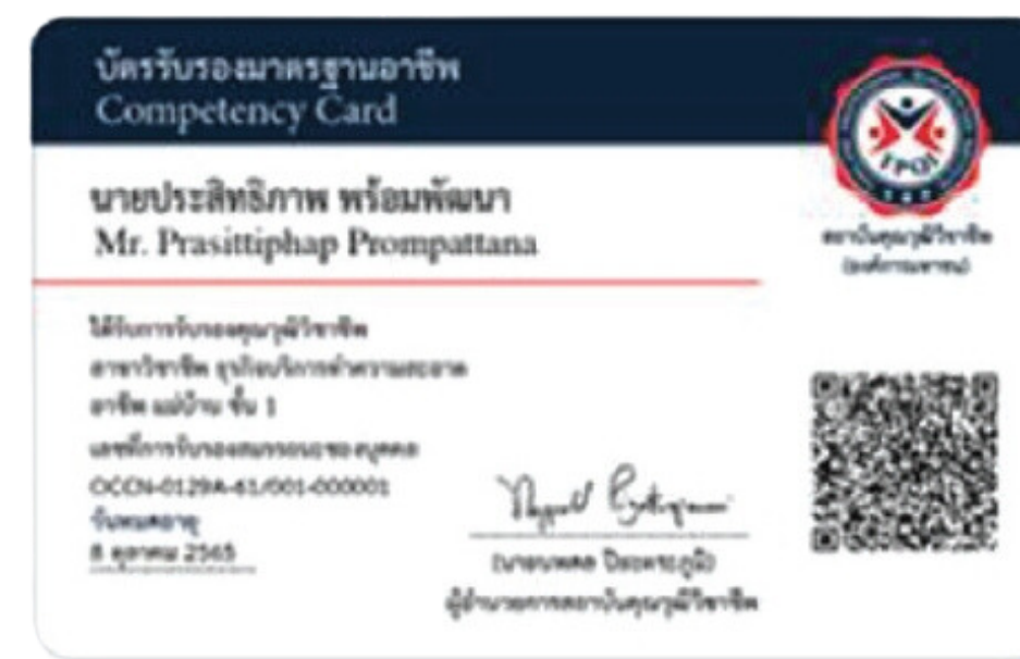
3. บัตรรับรองมาตรฐานอาชีพ