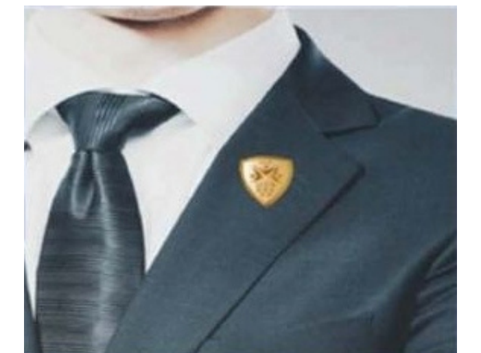
4. เข็มกลัด มอช