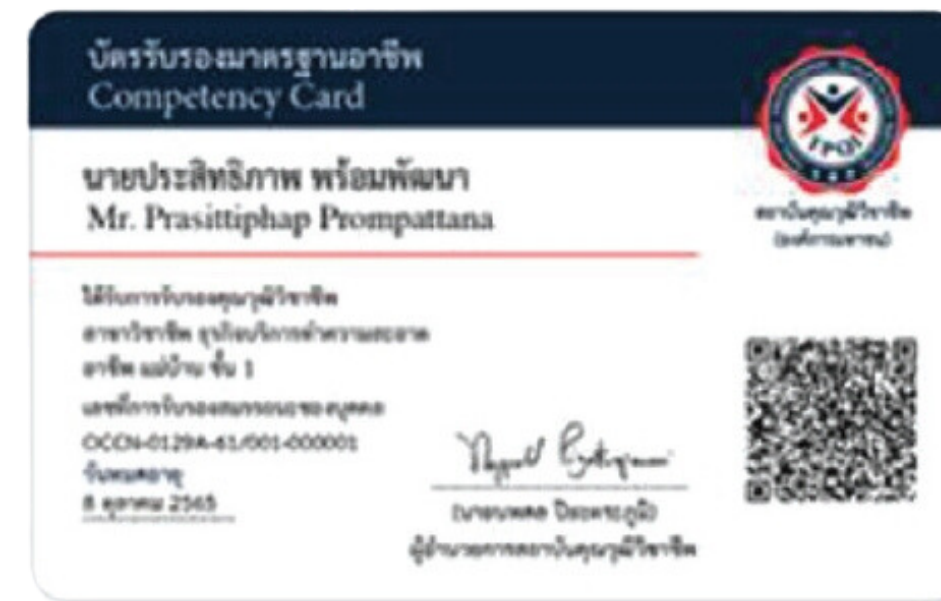
3. บัตรรับรองมาตรฐานอาชีพ