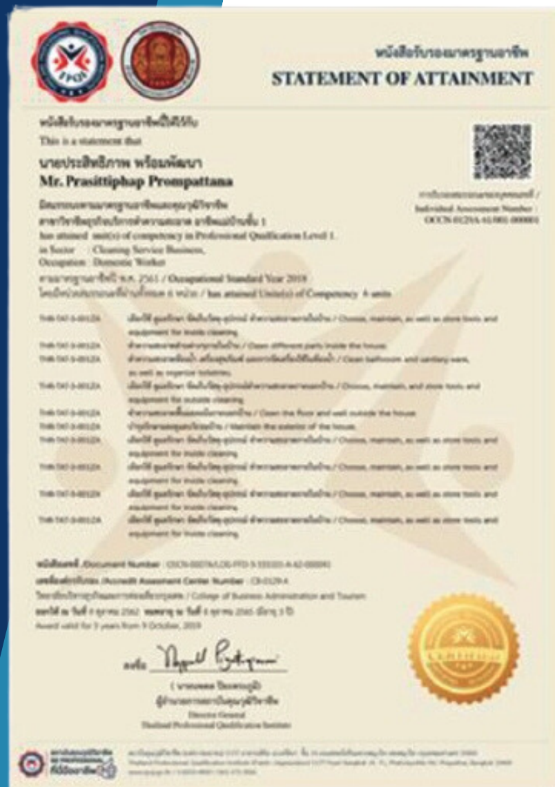
1. ใบประกาศนียบัตร คุณวุฒิวิชาชีพ