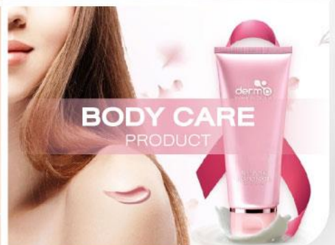
BODY CARE PRODUCT