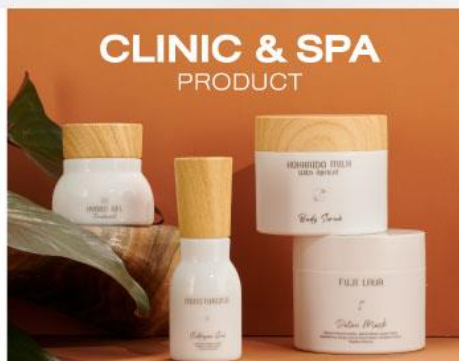
CLINIC & SPA PRODUCT