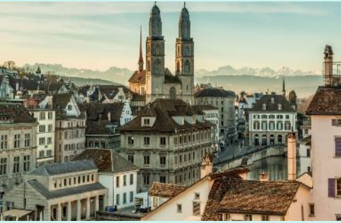
เก่าแก่ที่สุดของเมือง

นำท่านเดินทางสู่ เมืองซูริค (Zurich) (ใช้เวลาเดินทางประมาณ 45 นาที) เมืองที่มีขนาดใหญ่ที่สุดของสวิตเซอร์แลนด์ เมืองซูริคขึ้นชื่อเรื่องมนต์เสน่ห์ของเมืองยุโรปโบราณที่มีงานสถาปัตยกรรมแบบเก่า ในขณะที่เดียวกันก็เป็นเมืองที่มีความเจริญทางเทคโนโลยีสมัยใหม่และถูกยกให้เป็นหนึ่งในลำดับต้นๆของเมืองที่มีคุณภาพชีวิตดีที่สุดในโลก นำท่านเยี่ยมชมบรรยากาศ ย่านเมืองเก่าซูริค (Zurich Old Town) ผ่านชม โบสถ์หอคอยกรอสมุนเตอร์ (Grossmunster Church) โบสถ์หอคอยคู่สูงระฟ้าที่ถูกสร้างขึ้นในช่วงปี ค.ศ. 1100 ภายในมีงานประติมากรรมและสถาปัตยกรรมการตกแต่งที่สวยงาม ผ่านชม โบสถ์เซนต์ ปีเตอร์ (St. Peter's Church) หอนาฬิกาที่มีหน้าปัดนาฬิกาที่ใหญ่ที่สุดในทวีปยุโรป โดยมีเส้นผ่านศูนย์กลางที่ยาวถึง 8.7 เมตร และระฆังทั้ง 5 ใบที่ตีบอกเวลา ทำมาตั้งแต่ปี ค.ศ. 1880 นอกจากนี้โบสถ์แห่งนี้ยังเป็นโบสถ์ที่