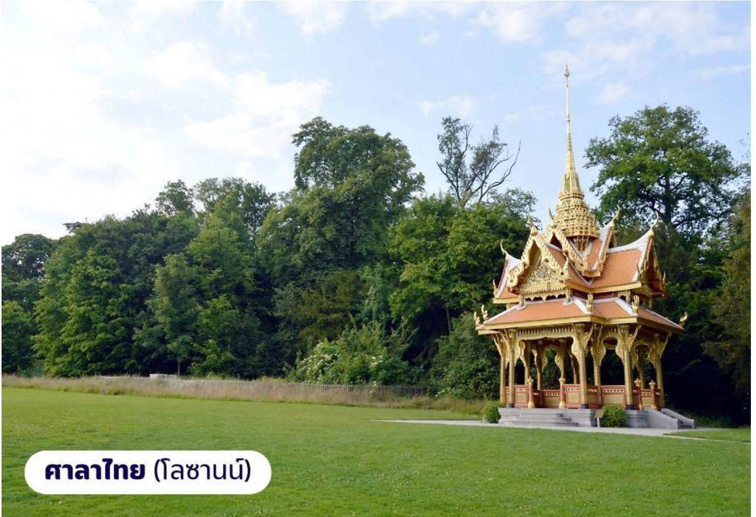
ศาลาไทย (โลซานน์)

ประเทศสวิตเซอร์แลนด์ ตั้งอยู่บนเนินเขาริมฝั่งทะเลสาบเจนีวา มีความสวยงาม โดยธรรมชาติ กับทิวทัศน์ที่สวยงาม และอากาศที่ปราศจากมลพิษ จึงดึงดูด นักท่องเที่ยวจากทั่วโลกให้มาพักผ่อนตากอากาศ นำท่านถ่ายภาพ อาคาร สำนักงานโอลิมปิกสากล ซึ่งตั้งอยู่บริเวณทะเลสาบเลคเลมังค์ จากนั้นนำท่าน ถ่ายภาพและเยี่ยมชม ศาลาไทย ที่รัฐบาลไทยได้ร่วมกันก่อสร้างให้เมืองโลซานน์ ในวโรกาสเฉลิมฉลองพระบาทสมเด็จพระเจ้าอยู่หัวทรงครองราชย์ครบ 60 ปีและ เชื่อมความสัมพันธ์ไทย-สวิสฯ ครบ 75 ปี