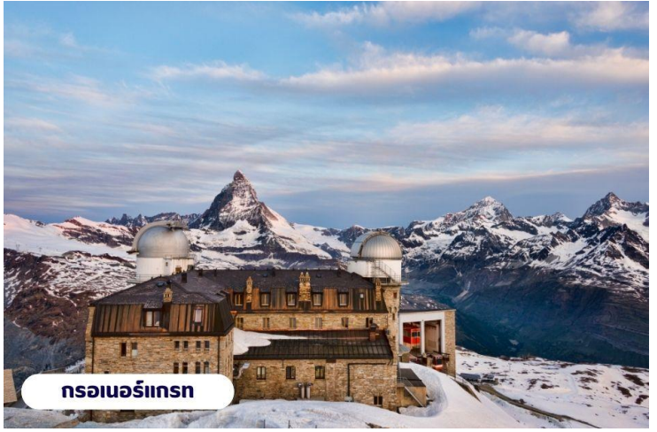
กรอนเนอร์เกรท

ถึงเวลาอันสมรนำท่านเดินทางกลับสู่เมืองเซอร์แมทอีกครั้งโดยรถไฟ อีสระ ท่านเดินเล่นชมเมืองเซอร์แมท เลือกซื้อสินค้าของฝากพื้นเมือง หรือนาฬิกาสวิส อันขึ้นชื่อตามอัธยาศัย สมควรแก่เวลานำท่านขึ้นรถไฟกลับสู่เมืองแทสซ์