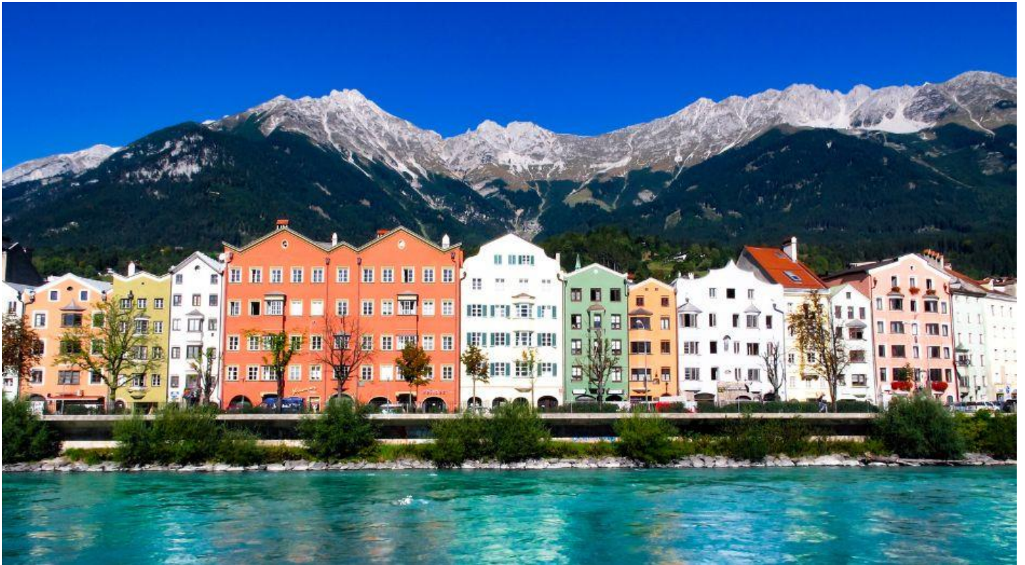
ต่อมาจักรพรรดิ Maximilian

สำคัญของเมืองอินส์บรุค ซึ่งตั้งอยู่ในเขตเมืองเก่าสร้างขึ้นโดยจักรพรรดิ Friedrich ที่ 4 ในช่วงต้นศตวรรษที่ 15 สำหรับเป็นที่ประทับของผู้ปกครองแคว้นทิโรล