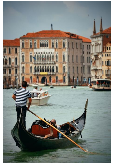
Delfino Venice Mestre หรือเทียบเท่า