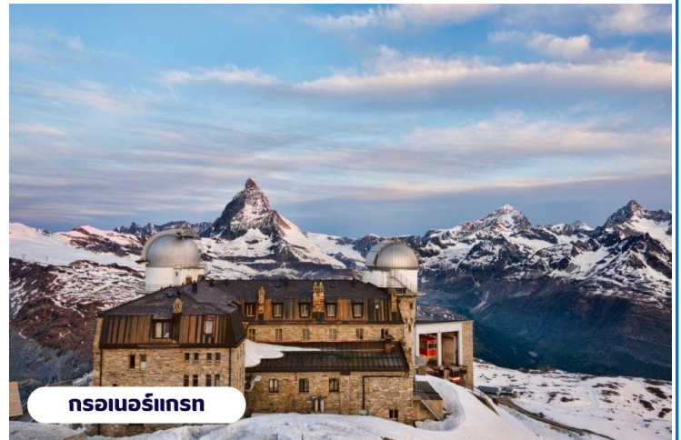
กรอนเนอร์แกรท