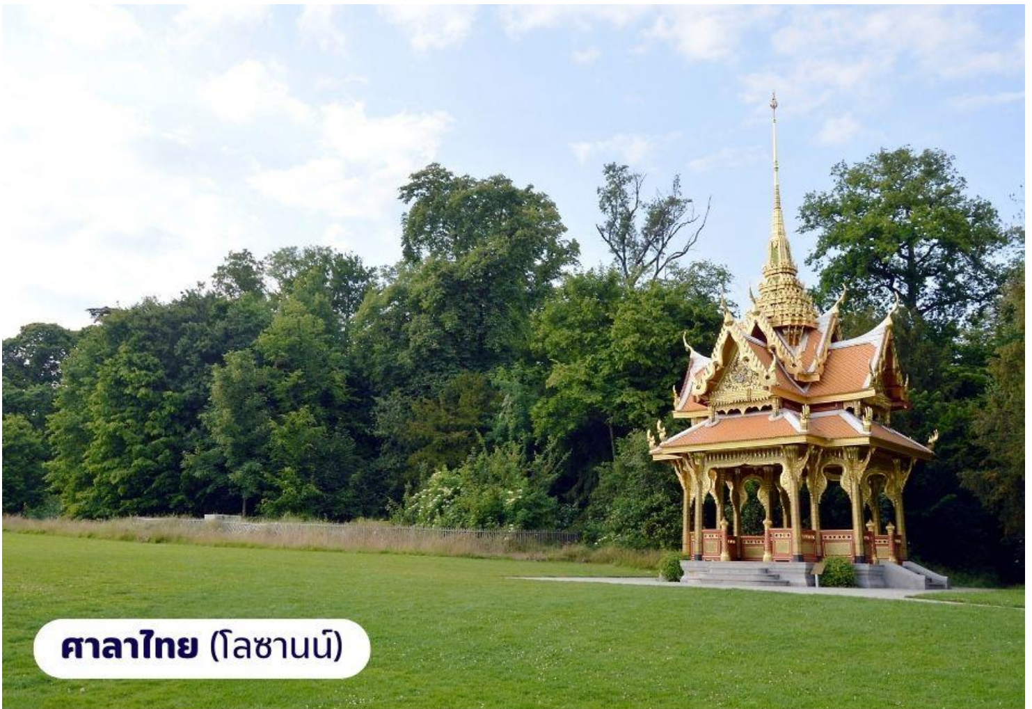
ศาลาไทย (โลซานน์)

จากนั้นนำท่านเดินทางไปยัง เมืองโลซานน์ เป็นอีกเมืองที่ตั้งอยู่บนของทะเลสาบเจนีวา เมืองโลซานน์นับได้ว่าเป็นเมืองที่มีเสน่ห์โดยธรรมชาติมากที่สุดเมืองหนึ่งของ สวิตเซอร์แลนด์มีประวัติศาสตร์อันยาวนานมาตั้งแต่ศตวรรษที่ 4 ในสมัยที่ชาวโรมันมาตั้งหลักแหล่งอยู่บริเวณริมฝั่งทะเลสาบที่นี่ เนื่องจากเมืองโลซานน์ตั้งอยู่บนเนินเขาริมฝั่งทะเลสาบเลคเจนีวา จึงมีความสวยงามโดยธรรมชาติ ทิวทัศน์ที่สวยงามและอากาศที่ปราศจากมลพิษ จึงดึงดูดนักท่องเที่ยวจากทั่วโลกให้มาพักผ่อนตากอากาศที่นี่ เมืองนี้ยังเป็นเมืองที่มีความสำคัญสำหรับชาวไทยเนื่องจากเป็นเมืองที่เคยเป็นที่ประทับของสมเด็จพระเจ้านำท่านถ่ายภาพ อาคารสำนักงานโอลิมปิกสากล ซึ่งตั้งอยู่บริเวณทะเลสาบเลคเจนีวา จากนั้นนำท่านถ่ายภาพและเยี่ยมชม ศาลาไทย ที่รัฐบาลไทยได้ร่วมกันก่อสร้างให้เมืองโลซานน์ ในวโรกาสเฉลิมฉลองพระบาทสมเด็จพระเจ้าอยู่หัวทรงครองราชย์ครบ 60 ปีและเชื่อมความสัมพันธ์ไทย-สวิสฯ ครบ 75 ปี