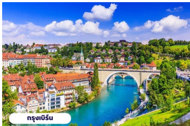
กรุงเบิร์น

📍 บริการอาหารเช้า ณ ห้องอาหารของโรงแรม จากนั้นนำท่านเที่ยวชมสถานที่สำคัญต่างๆในกรุงเบิร์น กรุงเบิร์นได้รับการยกย่องจากองค์การยูเนสโกให้เป็นเมืองมรดกโลก ในปี ค.ศ. 1863 นอกจากนี้เบิร์น ยังถูกจัดอันดับอยู่ใน 1 ใน 10 ของเมืองที่มีคุณภาพชีวิตที่ดีที่สุดในโลกในปี ค.ศ. 2010 นำท่านชม บ่อหมีสีน้ำตาล สัตว์ที่เป็นสัญลักษณ์ของกรุงเบิร์น นำท่านชม มาร์กาสเซ ย่านเมืองเก่า ปัจจุบันเต็มไปด้วยร้านดอกไม้และบูติก เป็นย่านที่ปลอดภัยนึ่ง จึงเหมาะกับการเดินเที่ยวชมอาคารเก่า อายุ 200-300 ปี นำท่านลัดเลาะชม ถนนจุงเคอร์นกาสเซ ถนนที่มีระดับสูงสุดของเมืองนี้ ซึ่งเต็มไปด้วยร้านภาพวาดและร้านขายของเก่าในอาคารโบราณ ชม นาฬิกาใช้ท่คัล็อคเค่นทรม อายุ 800 ปี ที่มีโชว์ให้ดูทุกๆ ชั่วโมงในการตีบอกเวลาแต่ละครั้ง หอนาฬิกานี้ ในช่วงปี ค.ศ. 1191-1256 ใช้เป็นประตูเมืองแห่งแรก ภายหลังได้ตัดแปลงใช้ท่คัล็อคเค่นทรมให้กลายเป็นหอนาฬิกา พร้อมติดตั้งนาฬิกาดาราศาสตร์เข้าไป จากนั้นอิสระให้ท่านเดินเล่นและเก็บภาพตามอัธยาศัยหรือจะเลือกซื้อปึงซื่อสินค้าแบรนด์เนมและซื่อของที่ระลึก