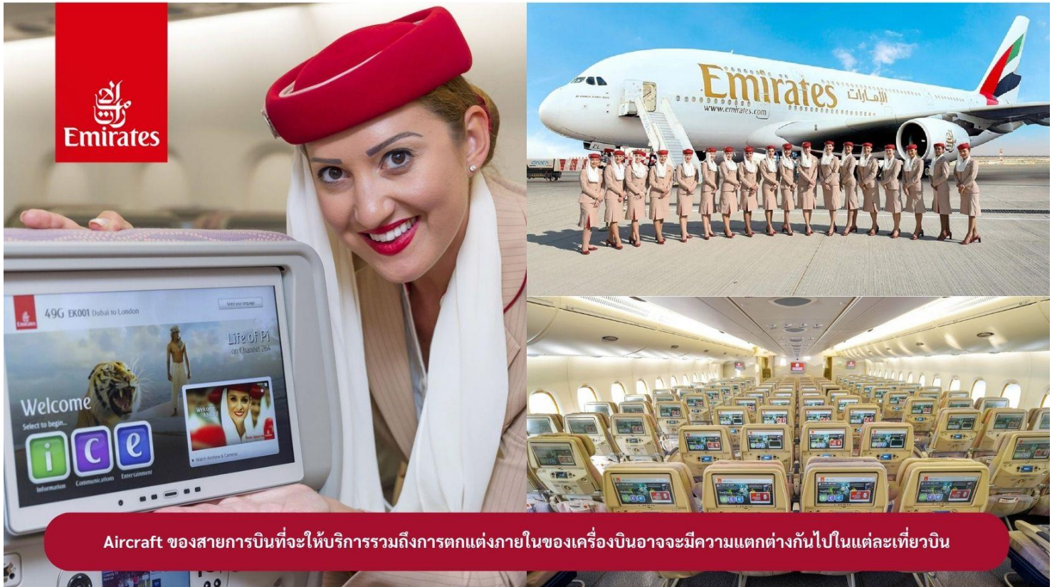
Aircraft ของสายการบินที่จะให้บริการรวมถึงการตกแต่งภายในของเครื่องบินอาจจะมีความแตกต่างกันไปในแต่ละเที่ยวบิน

22.00 น. !!!! ขณะเดินทางพร้อมกัน ณ สนามบินสุวรรณภูมิ อาคารผู้โดยสารขาออกระหว่างประเทศ ชั้น 4 ประตู 9 แถว T สายการบินเอมิเรตส์ แอร์ไลน์ (EK) เจ้าหน้าที่ให้การต้อนรับและอำนวยความสะดวก