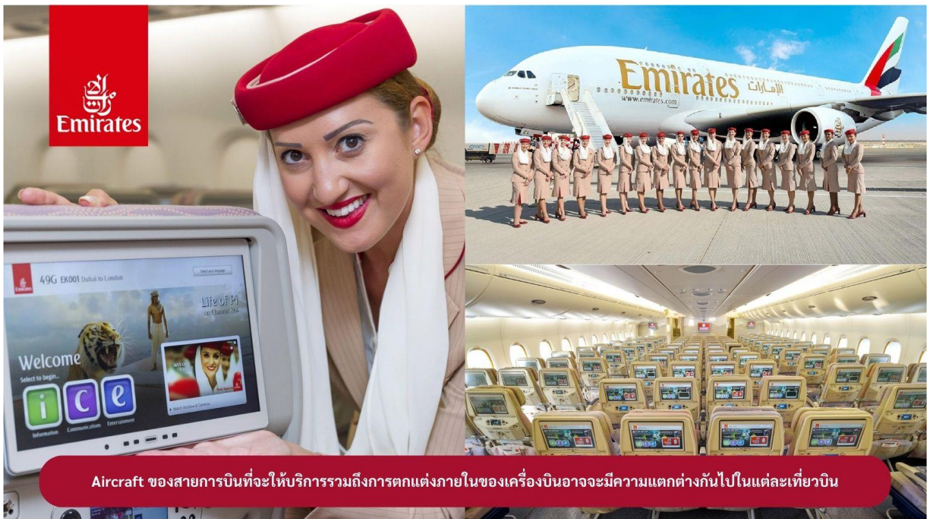
Aircraft ของสายการบินที่จะให้บริการรวมถึงการตกแต่งภายในของเครื่องบินอาจมีความแตกต่างกันไปในแต่ละเที่ยวบิน