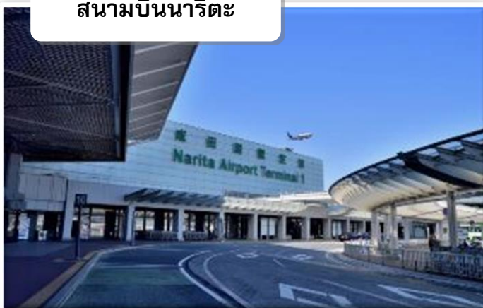
สนามบินนาริตะ

เวลา 08.00น. เดินทางถึง สนามบินนาริตะ นำท่านผ่านขั้นตอนการตรวจคนเข้าเมืองและศุลกากร