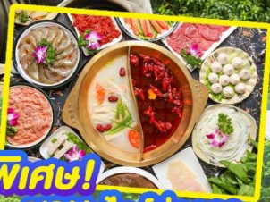
พิเศษ! ชาบูสโกล์ฮ่องกง