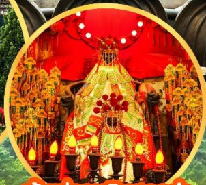
เจ้าแม่กวนอิมฮองฮ่า