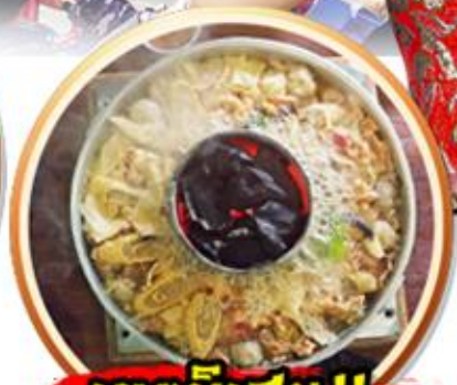
เมนูพิเศษ!! สุกี้เห็ดไก่ดำ+ปลาเซลมอน