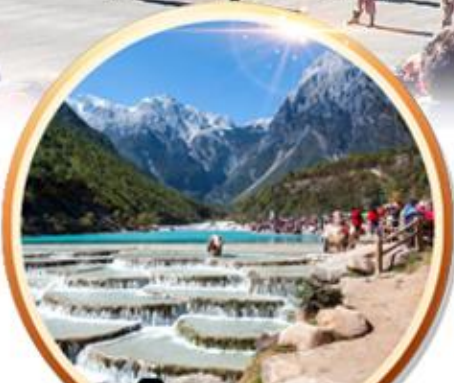
ยอดใจความงาม หุบเขาพระจันทร์สีน้ำเงิน

เดินทาง 23-28 มี.ย. 67 08-13 / 15-20 ก.ย. 67 6 วัน 5 คืน