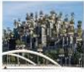
Tian An 1,000 Tree