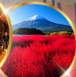
โออิชิ พาร์ค

ราคา เริ่มต้น 39,919 บาท รวมภาษีมูลค่าเพิ่ม 7%