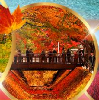
อุโมงค์เมบิล