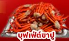
บุฟเฟ่ต์ขาปู

ราคา เริ่มต้น 39,919 บาท รวมภาษีมูลค่าเพิ่ม 7%