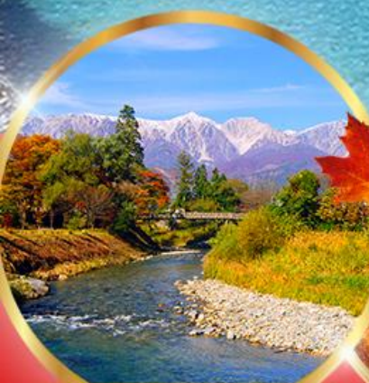
โออิเดะ พาร์ค