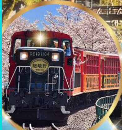
รถไฟสายโรแมนติก