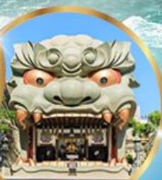
ศาลเจ้านิมะ ยาชากะ