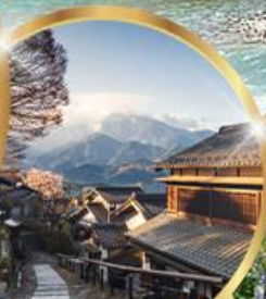
มาโกเมะจุกุ