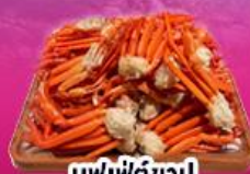
บุฟเฟ่ต์ซาซุ