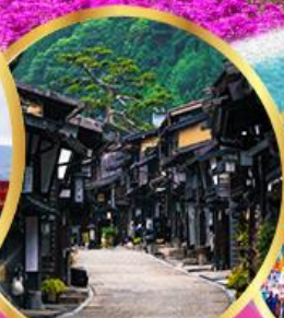
นาราจุกุ