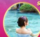
พัทออนเซ็น 1 คืน