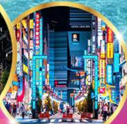
ซัปโปโปะชิโนจุกุ