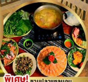
พิเศษ! ซาบูปลาเซลมอน หม้อไฟลาสเตอร์เจียน + ไวน์ดิลิต