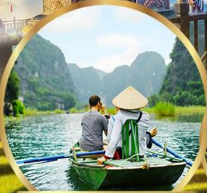
ล่องเรือกระจัดชมต้าตามกิก