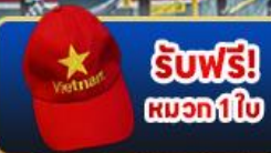
รับฟรี! หมวก1ใบ