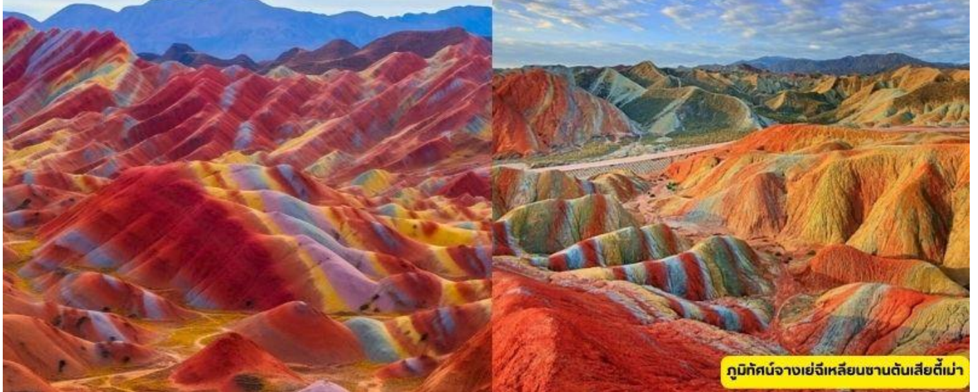
ภูมิตันเจียงเย่ฉีเหลียนซานตันเสียดี้เมา

วันที่สาม เมืองจางเย่ – วัดต้าฝอซื่อ – ภูมิตันเจียงเย่ฉีเหลียนซานตันเสียดี้เมา - เมืองเจียอี้กวน