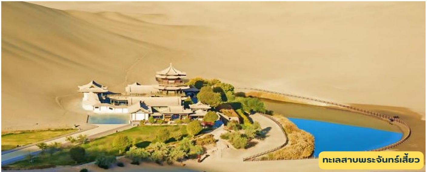
ทะเลสาบพระจันทร์เสี้ยว

เช้า ๑๐) รับประทานอาหารเช้า ณ ห้องอาหารโรงแรม