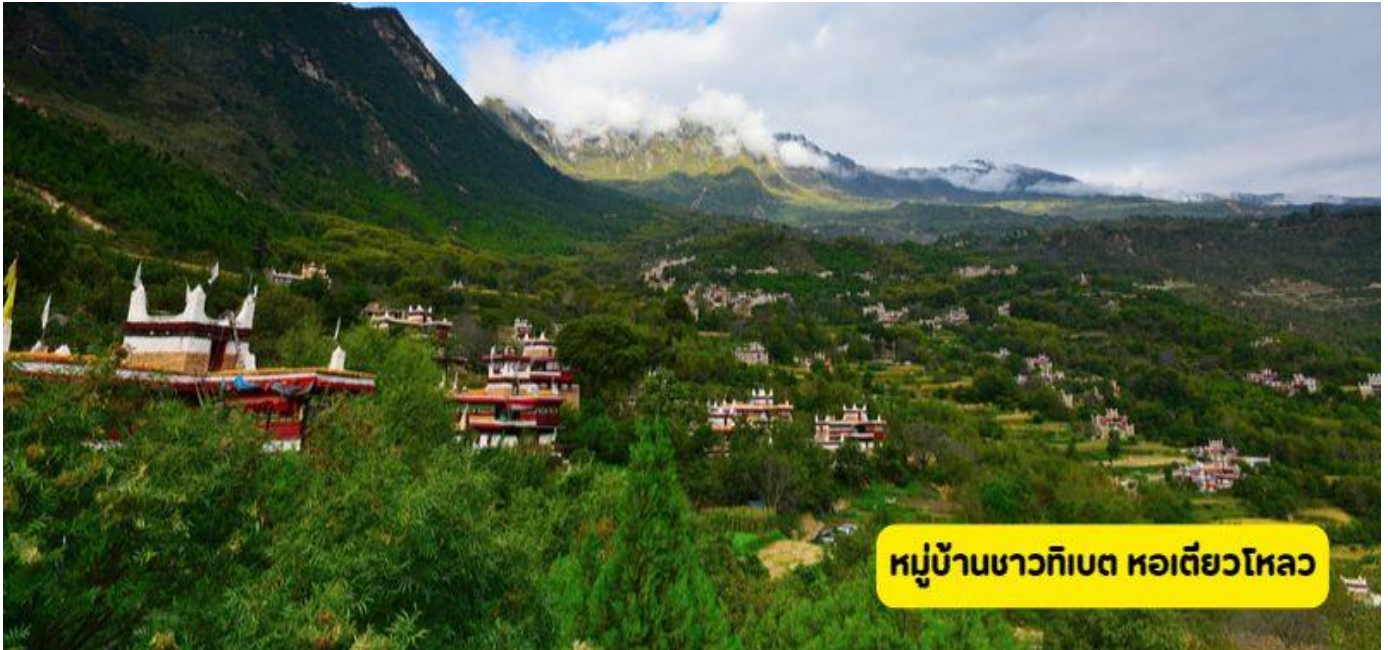
หมู่บ้านชาวทิเบต หอเตี้ยวโหลว

อุทยานภูเขาสีดรุณี – หมู่บ้านชาวทิเบต - หอเตี้ยวโหลว – เมืองซินตูเจียว - เมืองหย่าเจียง