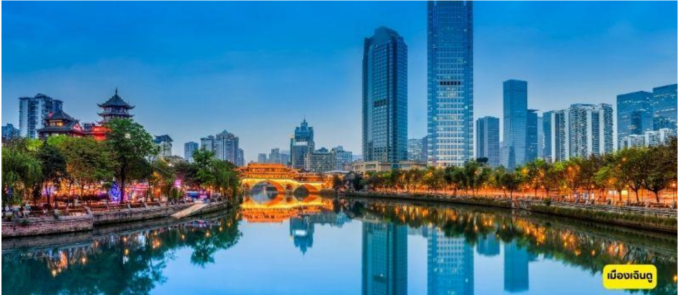
เมืองเฉินตู

วันแรก กรุงเทพฯ (ดอนเมือง) – เมืองเฉินตู (9C7502:13.35 -18.00 น.)