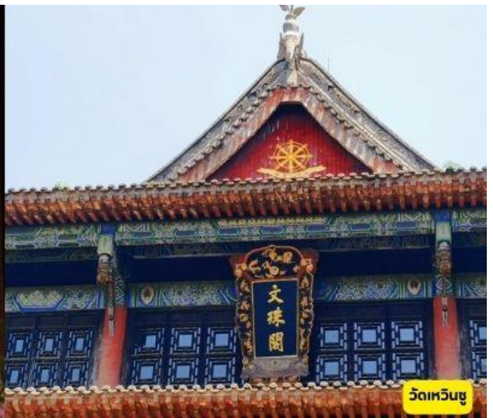
วัดเหวินชู่

เช้า ๑๐ รับประทานอาหารเช้า ณ ห้องอาหารโรงแรม