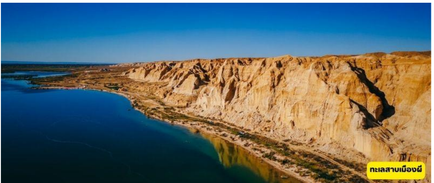
ทะเลสาบเมืองผี

เช้า ๑๐ | รับประทานอาหารเช้า ณ ห้องอาหารโรงแรม