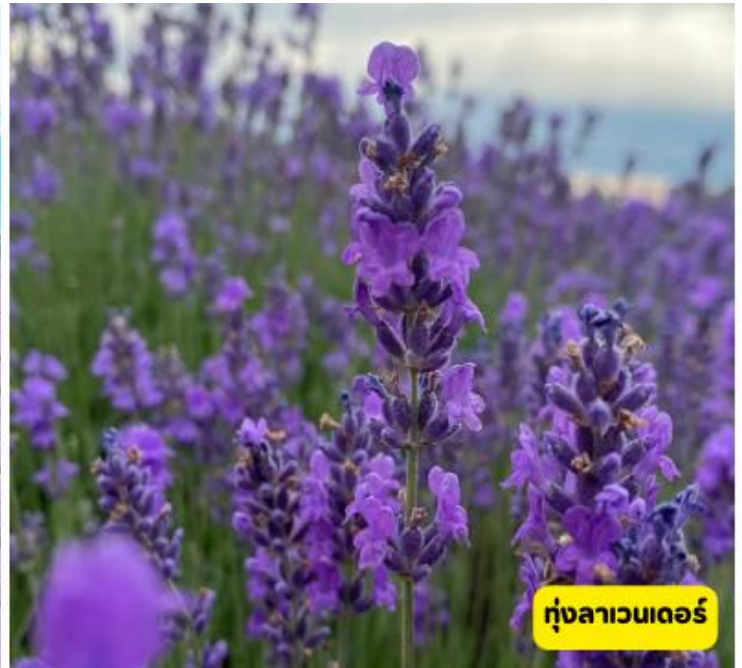
ทุ่งลาเวนเดอร์