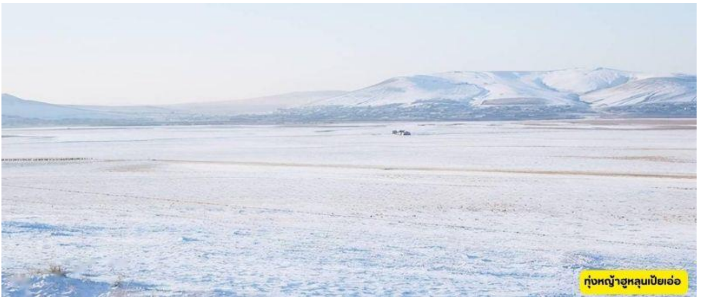
ทุ่งหญ้าฮูลุนเบียเอ่อ

ทุ่งหญ้าฮูลุนเบียเอ่อ – ตู้เมืองแมนจูเลียหรือหม่านโจวหลี่