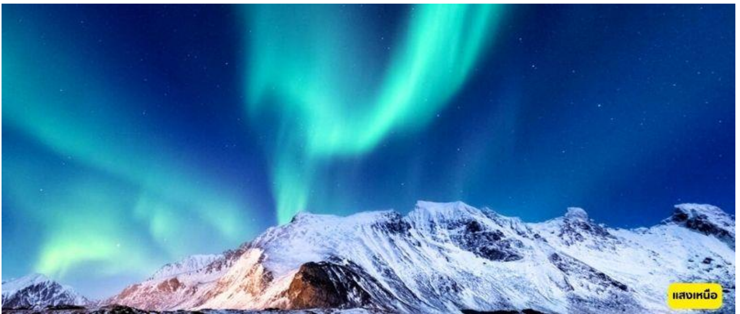
แสงเหนือ

เขาพระपोธิสัตว์กวนอิม – หุบเขาเอียนจื่อ - ชมหอระลึกท่าน หลี่ จิน ยง - หมู่บ้านเป่ย์จี - อนุสาวรีย์เสินโจว – ที่ทำการไปรษณีย์เหนือสุด – จตุรัสไก่อทอง - โม่เหอ