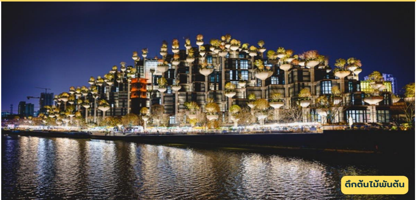
ตึกต้นไม้พันต้น

03.15 น. ออกเดินทางสู่เมืองปักกิ่ง สายการบิน แอร์ไชนา เที่ยวบินที่ CA806 :03.15-08.30 (บริการอาหารและเครื่องดื่มบนเครื่อง)