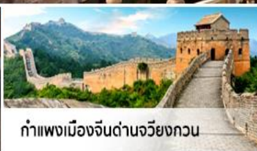
กำแพงเมืองจีนด่านจวิ๊ยกทวน