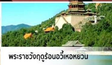
พระราชวังฤดูร้อนอวิ๋หลอหยวน