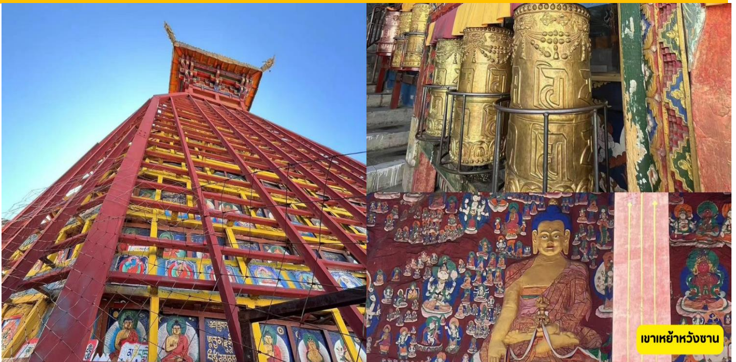
เขาหย้าหวังซาน