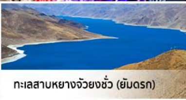
ทะเลสาบหยางจิวยงซัว (ยิมดรก)