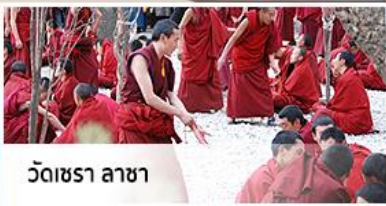
วัดชรา ลาซา